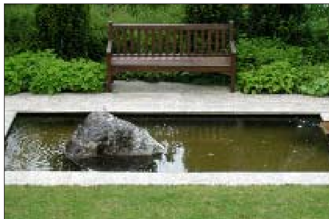
Hier finden Körper und Geist Ruhe und Ordnung

den, Gehölze und Blumenzwiebel, Sommerblühende und dann herbstfärbende leuchtende Gehölze gehören einfach in jeden Garten. Gräser, über die sich im Herbst und im Winter sanft der Raureif legt und deren Wuchs und Schönheit erst durch solche Glanzpunkte richtig zur Geltung kommen, sind unverzichtbar. Um die ganz persönlichen Bedürfnisse auch in den unterschiedlichen Lebensphasen optimal realisieren zu können, empfiehlt Gartenarchitekt Florian Sigmund die sorgfältige konzeptionelle Planung – und zwar unbedingt bevor die Bagger anrücken.