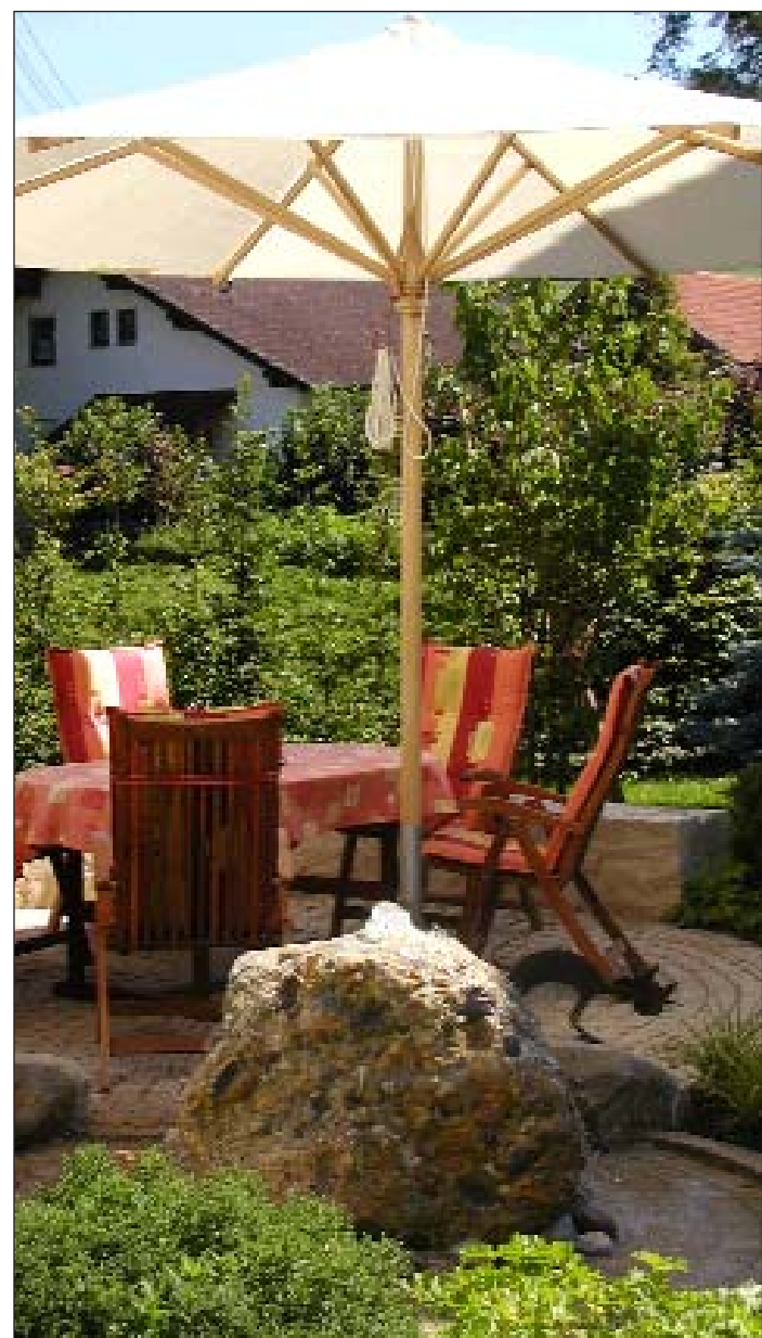
... zum Lieblingsplatz im Freien