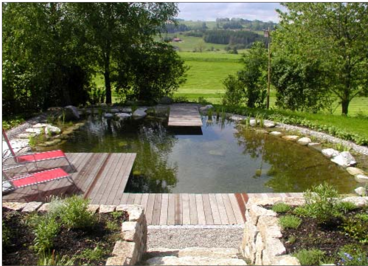
Was für ein Ausblick: Dieser Garten hat ein Gute-Laune-Abo für das ganze Jahr

Belebend wirken kleine Wasserflächen oder Wasserspiele (Quellsteinen), sowie ein Sitzplatz im Garten (und nicht nur am Haus) aus Natursteinpflaster oder Rieselbelag. Die Tiefe des Gartens verstärkt man durch Blickbezüge, zu einer Bank, einer kleinen Laube oder Pergola. Gestaltungsmöglichkeiten gibt es viele: entweder architektonisch streng mit rechteckiger Rasenfläche, Buchshecken, Wasserbecken, Holzdeck oder romantisch mit amorphen Formen und üppig mit Stauden, Rosen, Hecken bepflanzt.