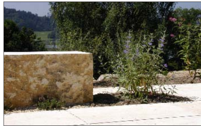
Eine Natursteinmauer als Gestaltungselement

Druck: Druckhaus Dessauerstraße GmbH & Co. Betriebs KG Dessauerstraße 10 80992 München