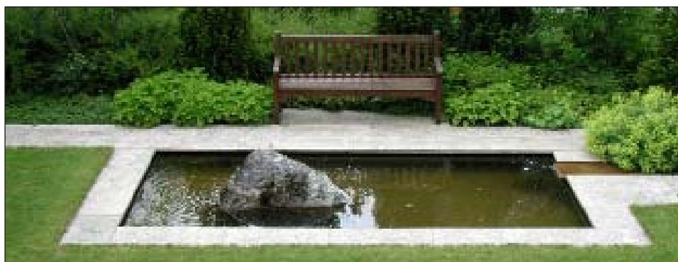
Hier finden Körper und Geist Ruhe und Ordnung

legt, sodass mehrere Stufen vom Wohnraum zum Außenraum notwendig sind. Das schafft Distanz und trennt damit automatisch vom Gartenraum. In solchen Fällen schlägt Sigmund seinen Bauherren vor, über ein Hochdeck aus hochwertigem Holzdielenbelag nachzudenken, um dem Haus einen wohlthuenden „Fuß“ zu geben und den Nutzraum