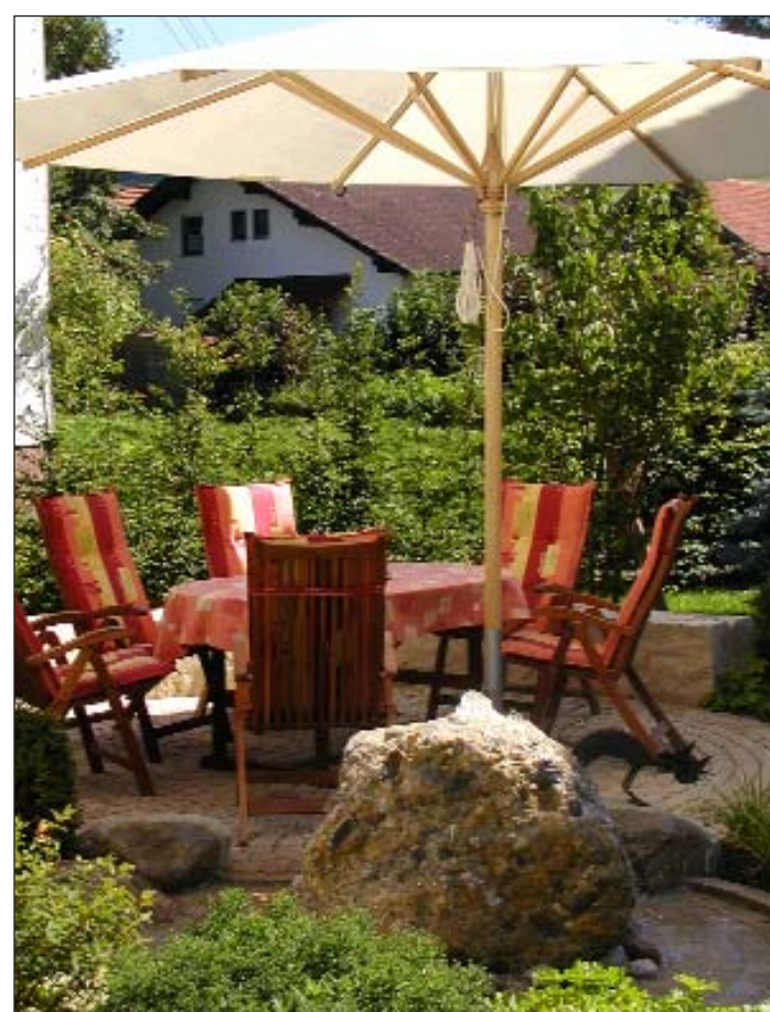
... zum Lieblingsplatz im Freien

Wasser im Garten ist ein wichtiges Thema, das die Sinne belebt und egal in welcher Form gestaltet – ob Naturteich, Design-Wasserbecken ohne Pflanzen, Schwimmteich oder Pool – ein bereicherndes Element in jedem Garten ist.