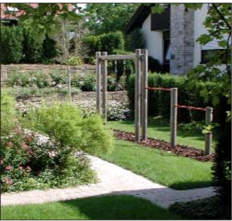
Wege gliedern auch kleine Gärten